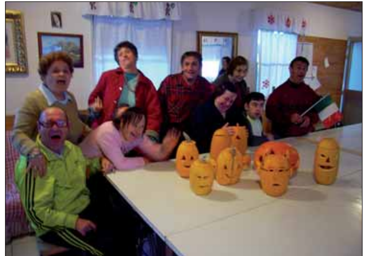
foto delle vere opere d'arte. Scontato dire che la notte non poche persone si sono spaventate alla viste delle nostre faccine illuminate.

Il 31 di ottobre, anche ad Userna ci siamo sentiti anche noi un po' americani, Infatti abbiamo anche realizzato le zucche di Halloween. Grazie all'aiuto degli orti dei nostri "nonni", sono arrivate più di dieci zucche gialle alla nostra sede, e dopo un pomeriggio decisamente all'insegna del colore e della paura, abbiamo realizzato come vedete nella